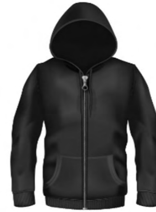
4. hoodie zippé