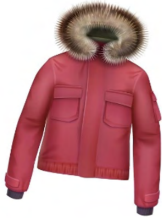
1. doudoune à capuche