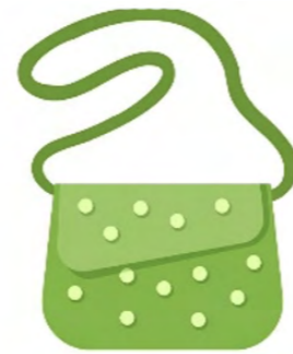
9. sac à main