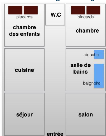
APPARTEMENT 90 m2