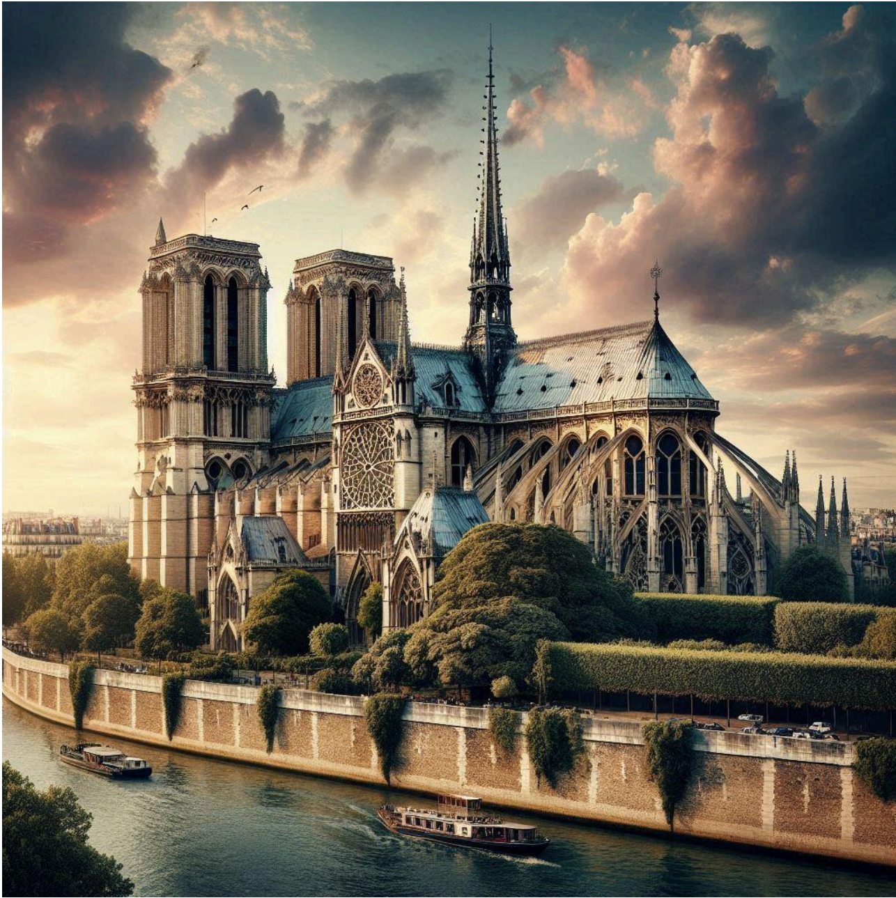
La Cathédrale Notre-Dame