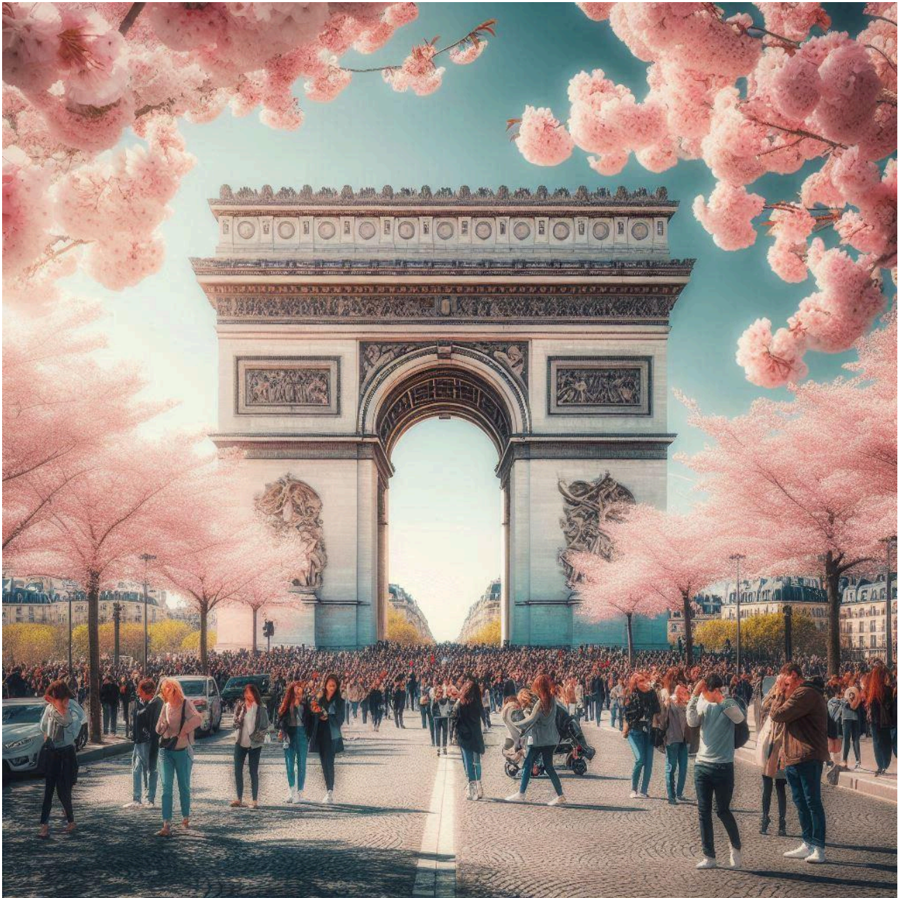
L'Arc de Triomphe