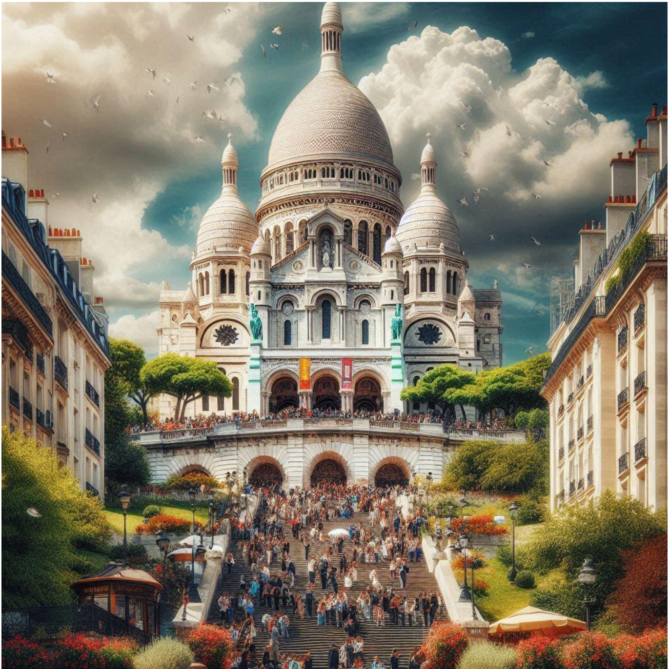
La Basilique du Sacré Cœur